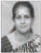
தலை - மூலம் தல.செலவுகள், காலம் செய்து