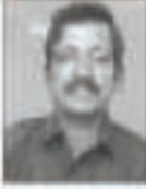
மேல்முதல் செய்க்படுவதில் மேல்முதல் செய்க்படுவதில்