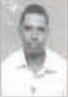
மேல்முதல் செய்க்படுவதில் மேல்முதல் செய்க்படுவதில்