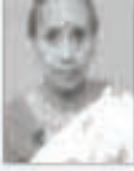
புலியில் மூலம் இப்போது நல்ல