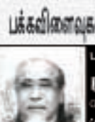
மேல்முதல் செய்க்படுவதில் மேல்முதல் செய்க்படுவதில்